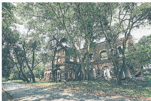
“绿肺”中的建筑建于1900年初曾是马来联邦铁路办公大楼。