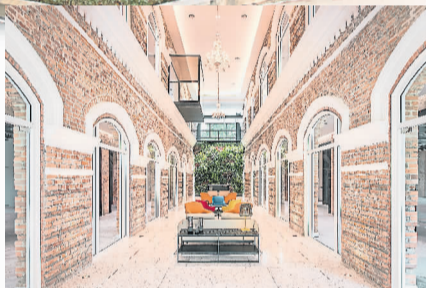
Sentul Works 中的新办公空间围绕原有的走廊展开，将之设计成中庭