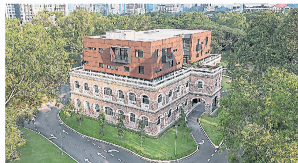
从 Sentul Works 望出去，便是一片绿油油的树林，令人舒心顺畅。